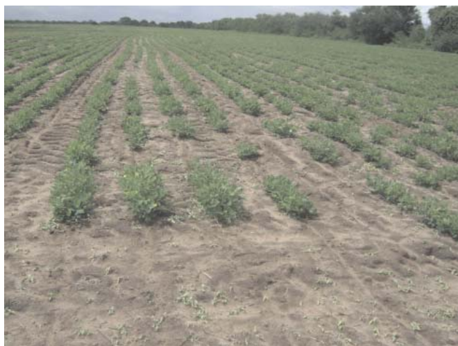
Fig. 3. Controle de plantas daninhas com herbicida pós-emergente, em lavoura de amendoim. Mogeiro/PB, 2008.

Atualmente o controle químico das plantas daninhas é o método mais utilizado principalmente entre os médios e grandes produtores. Quando empregados corretamente, os herbicidas atuam com eficiência e segurança, mesmo em áreas de pequenos produtores (Figura 3). Caso contrário, esses produtos poderão causar sérios prejuízos não somente à cultura, como também ao homem e ao